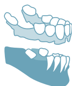
WORKFLOWS MIT BOHRSCHABLONEN