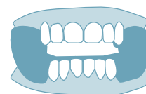
SCHALFAPNOE & APPARATUREN